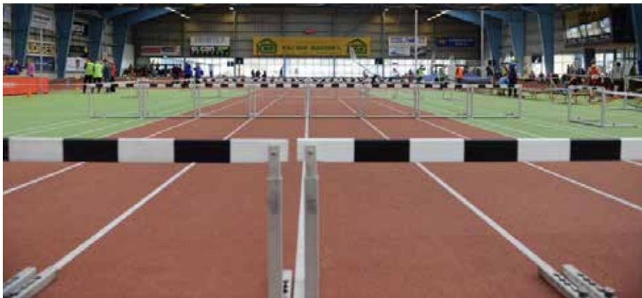
Spar Nord Arena

Medaljeoverrækkelsen gennemføres umiddelbart efter konkurrencerne.