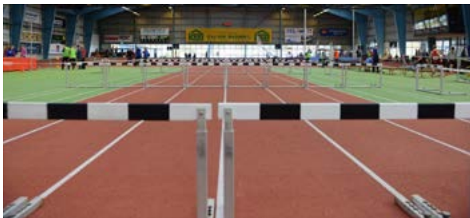
Spar Nord Arena

Medaljeoverrækkelsen gennemføres umiddelbart efter konkurrencerne.